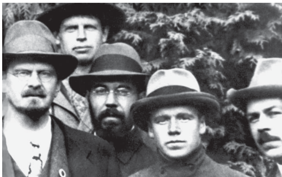
С.С. Четвериков, А.С. Серебровский, Г.Д. Карпеченко, Н.И. Вавилов (слева направо) на V Международном генетическом конгрессе в Берлине (1927 г.).