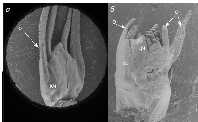
Рис. 2. СЭМ-анализ строения колоска развивающегося соцветия мягкой пшеницы у линии CD 1167-8.

Ости нижней цветковой (нцч) и колосковой (кч) чешуй обозначены серой и черной стрелками соответственно; з – зерновка; вцч – верхняя цветковая чешуя.