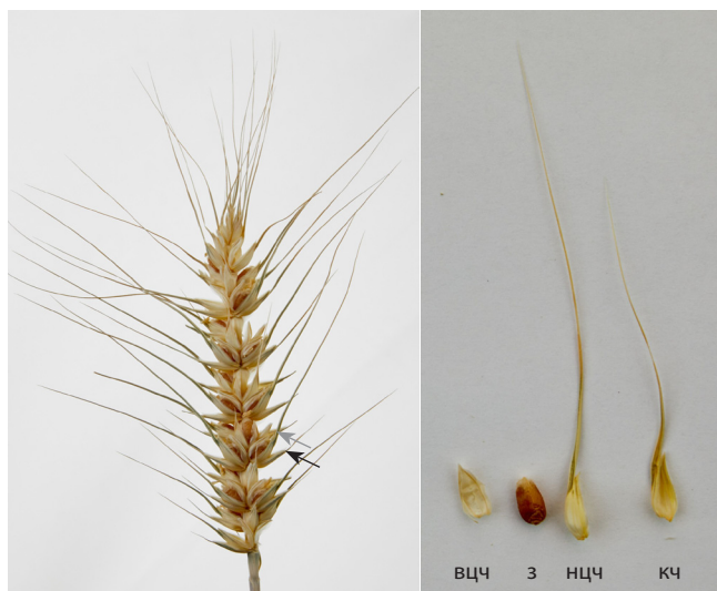
Рис. 1. Тетраостый колос линии мягкой пшеницы CD 1167-8.

Ости нижней цветковой (нцч) и колосковой (кч) чешуй обозначены серой и черной стрелками соответственно; з – зерновка; вцч – верхняя цветковая чешуя.