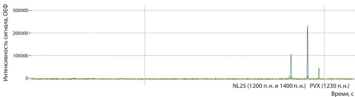
Рис. 2. Хроматограмма положительного контроля двух реакций (NL25, PVX).

тол»). Капиллярный электрофорез имеет высокую разрешающую способность, что позволяет идентифицировать близкие по длине фрагменты, в том числе за счет использования различающихся по спектру флуорофоров. Полученные данные анализировали с использованием программы «ДНК Фрагментный анализ» (ИАП РАН).