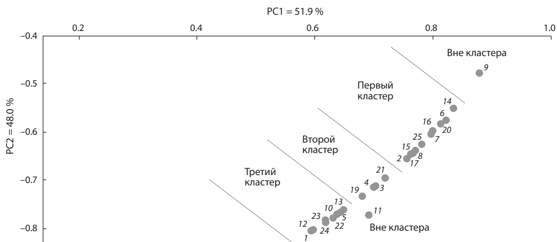
Рис. 1. Распределение сортов 16-17 КАСИБ на кластеры в системе двух главных компонент (PC1, PC2), рассчитанных по данным параметров адаптивности и отзывчивости: OAC_i , \sigma_{CAC_i} , S_{gi} , СЦГ_i , b_i , Hom .

Цифрами обозначены сорта: 1 – Каргала 66; 2 – Каргала 1412; 3 – Каргала 1514; 4 – Шарифа; 5 – Гордеиформе 950/99; 6 – Лавина; 7 – Дамсинская юбилейная; 8 – Шортандинская 256; 9 – Гордеиформе 18567-6; 10 – Гордеиформе 18585-2; 11–13 – стандарты местные; 14 – Гордеиформе 719; 15 – Гордеиформе 723; 16 – Гордеиформе 748; 17 – Гордеиформе 00-178-4; 18 – Гордеиформе 01-115-5; 19 – Гордеиформе 03-20-18; 20 – Елизаветинская; 21 – Валентина; 22 – Леукурум 1307Д-54; 23 – Леукурум 1469Д-21; 24 – Леукурум 1594Д-3; 25 – Безенчукская 139.