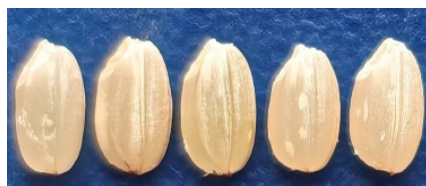
Короткозерный стекловидный рис