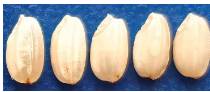
Короткозерный мучнистый рис