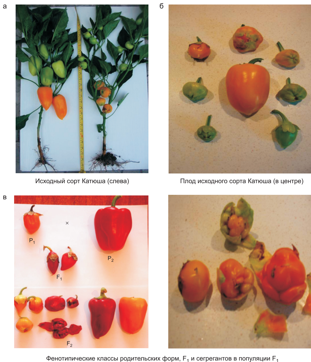
Рис. 1. Фенотип нового мутанта Calcc и его проявление в F_1 и F_2 .

были получены в обеих комбинациях, о чем свидетельствовал характер проявления маркерной красной окраски в F_1 и сегрегации по этому признаку в F_2 . В комбинации скрещивания Calcc с сортом Мираж расщепление по форме чашечки не произошло, так как мутант гетерозиготен по признаку «форма чашечки», а гибрид образовался при скрещивании гамет, несущей фактор нормальной чашечки. Форма чашечки у мутанта Calcc контролируется моногибридным доминантным фактором, наследуется независимо от фактора окраски