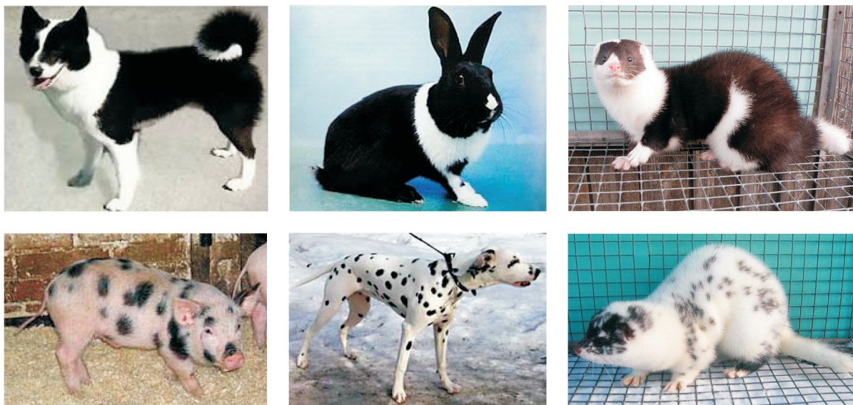
Рис. 3. Фенотипический параллелизм в окраске одомашненной американской норки в сравнении с другими исторически ранее одомашненными видами.

сяном покрове в ходе доместикации самых разных таксономических групп животных (рис. 4), нейтральным, не адаптивным? Вряд ли, ведь он вполне может быть сцеплен в наследовании с адаптивным признаком – устойчивостью к психоэмоциональному стрессу, проживанию в условиях неволи, успешному размножению изначально диких животных (внезапно оказавшихся по эволюционным меркам) в условиях антропогенной среды на расстоянии вытянутой руки человека.