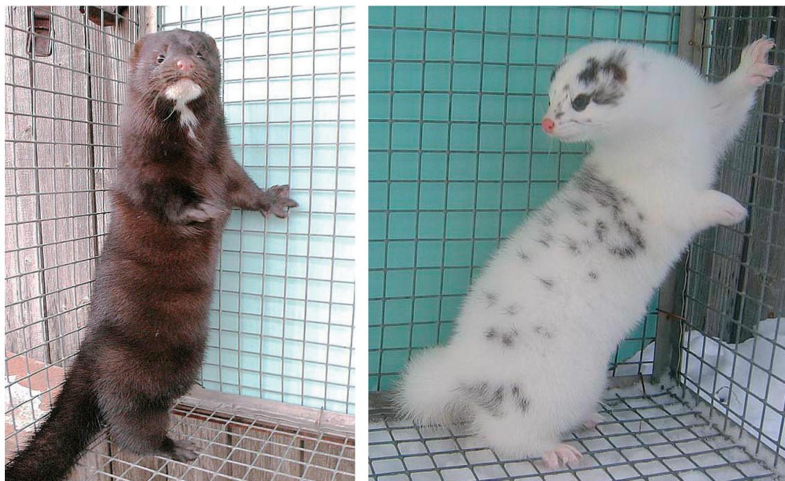
Рис. 1. В ходе доместикации американской норки регистрируется появление de novo окрасочных новшеств доминантной и полудоминантной природы, не встречавшихся в прежней эволюционной истории этого вида.

Слева – норка стандартной окраски дикого типа; справа – норка, несущая полудоминантную мутацию окраски меха.