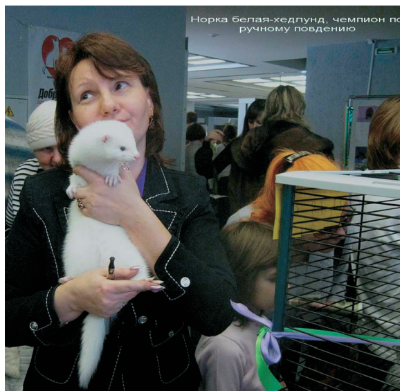
Рис. 2. Одомашненная норка.

В 1970-х годах модельные эксперименты Д.К. Беляева показывали, что резкие изменения среды при попадании диких животных в неволю, провоцируя состояние стресса, мобилизуют в популяциях животных скрытую генетическую изменчивость. Например, можно ли считать такой признак, как проявление белой пятнистости (пегостей) на воло-